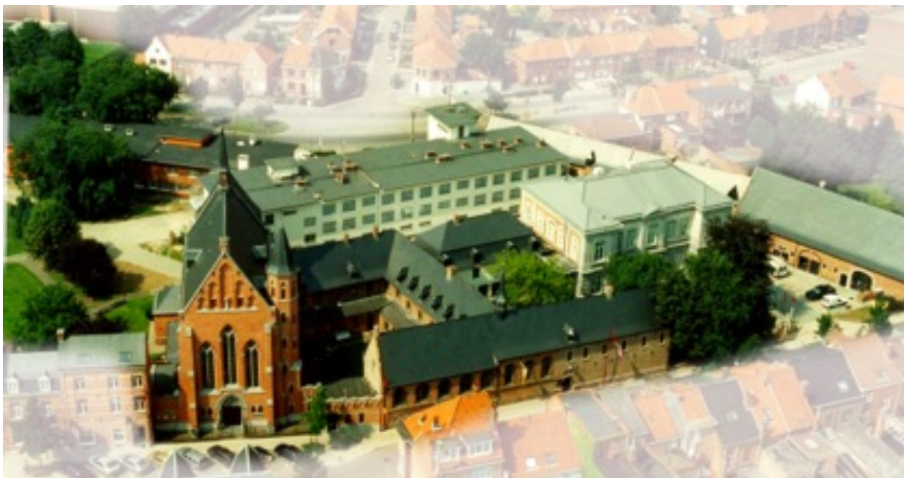
Neo-Gotische Gasthuiskapel (waar de receptie doorgaat) en het oude kloostergebouw (waar de tentoonstelling loopt).