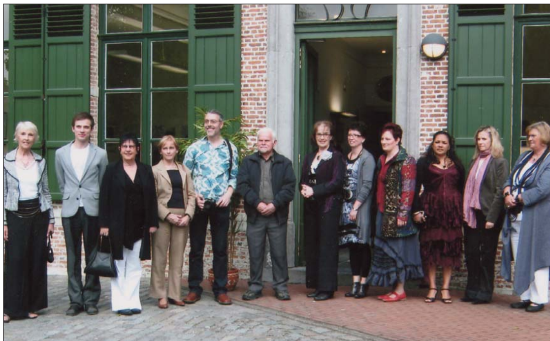
Foto onder: de (bijna) voltallige kunstenaarsgroep die we feliciteren met hun expositie...

BEZOEK OOK ONZE WEBSITE www.denederlandenzw.be /terugblik hever 15/5/2010. * VISITE - BESUCH - VISITA *