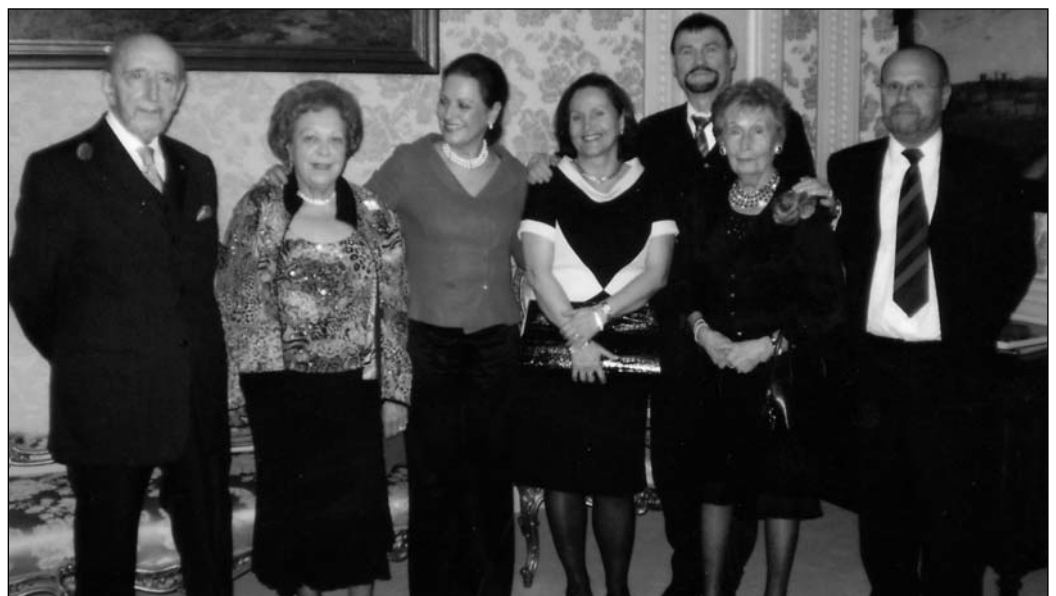
CDB sfeerbeeld in vriendenkring

L'actuel Château de Val Duchesse est le fruit des nombreuses transformations qui le modelèrent au cours des siècles, et qui se traduisent aujourd'hui par la présence de plusieurs styles d'architecture. L'aile sud, de style Louis XVI, est la plus ancienne. Au rez-de-chaussée on admire le très beau hall d'entrée avec ses marbres couvrant les murs et le sol: marbre vert d'Aoste, marbre blanc de Carrare, marbre rose du Portugal. Du côté parc, le salon doré d'inspiration Louis XVI, et à sa droite, la salle hollandaise et ses céramiques de Delft de couleur bleue et ses très beaux vitrages plombés. En face, la bibliothèque de style néo-Renaissance; et enfin, la salle flamande aux vitraux illustrant les fables de La Fontaine, cette pièce étant séparée du salon gothique par une arcade en pierre blanche joliment sculptée.